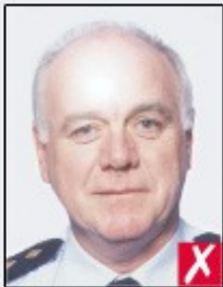
flash reflection on skin