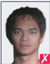
shadows behind head