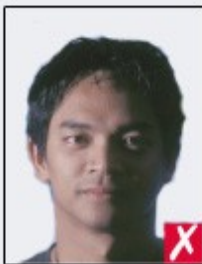
shadows across face