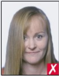
hair across eyes